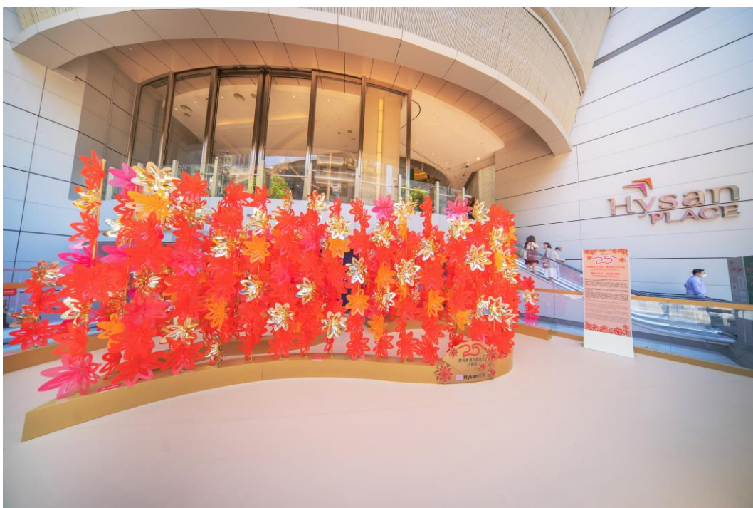
「和昌盛华 利园花开」艺术作品于利园一期及希慎广场展出。