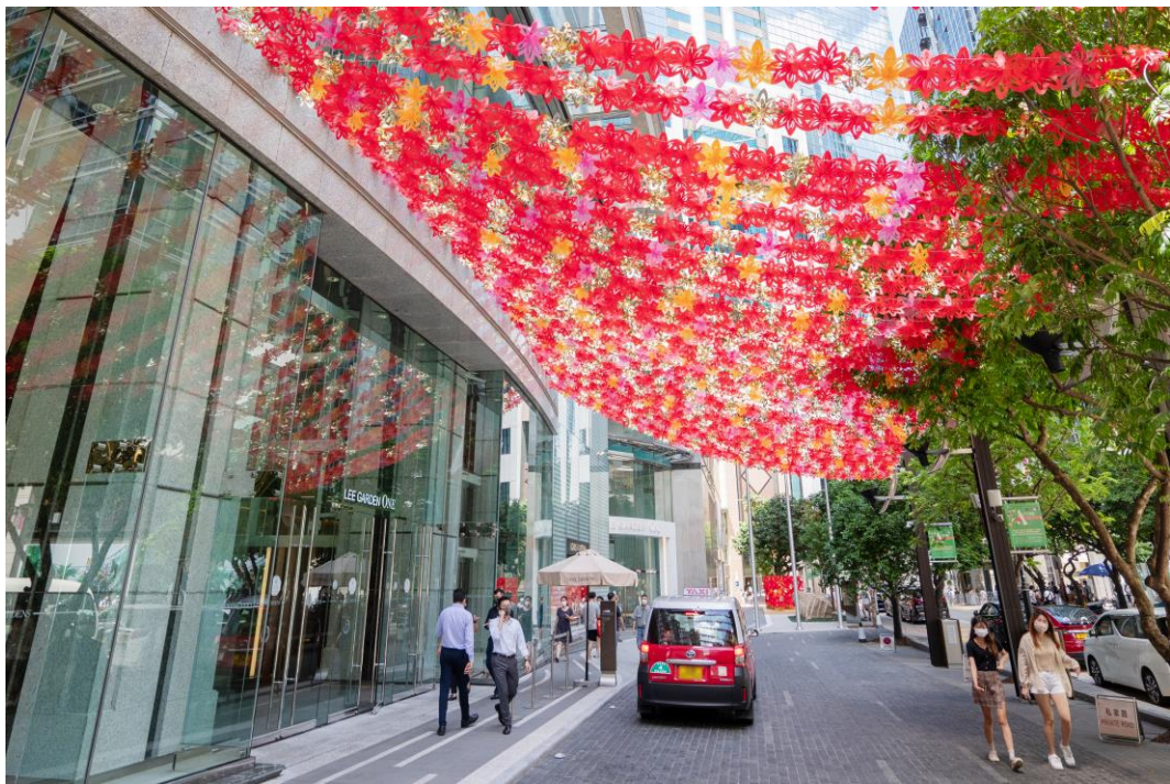
利园一期行车路上繁花盛放。