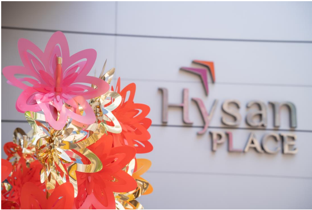
由纸艺艺术家黄文翰创作，灵感来自传统剪纸的立体花朵「利园花」。