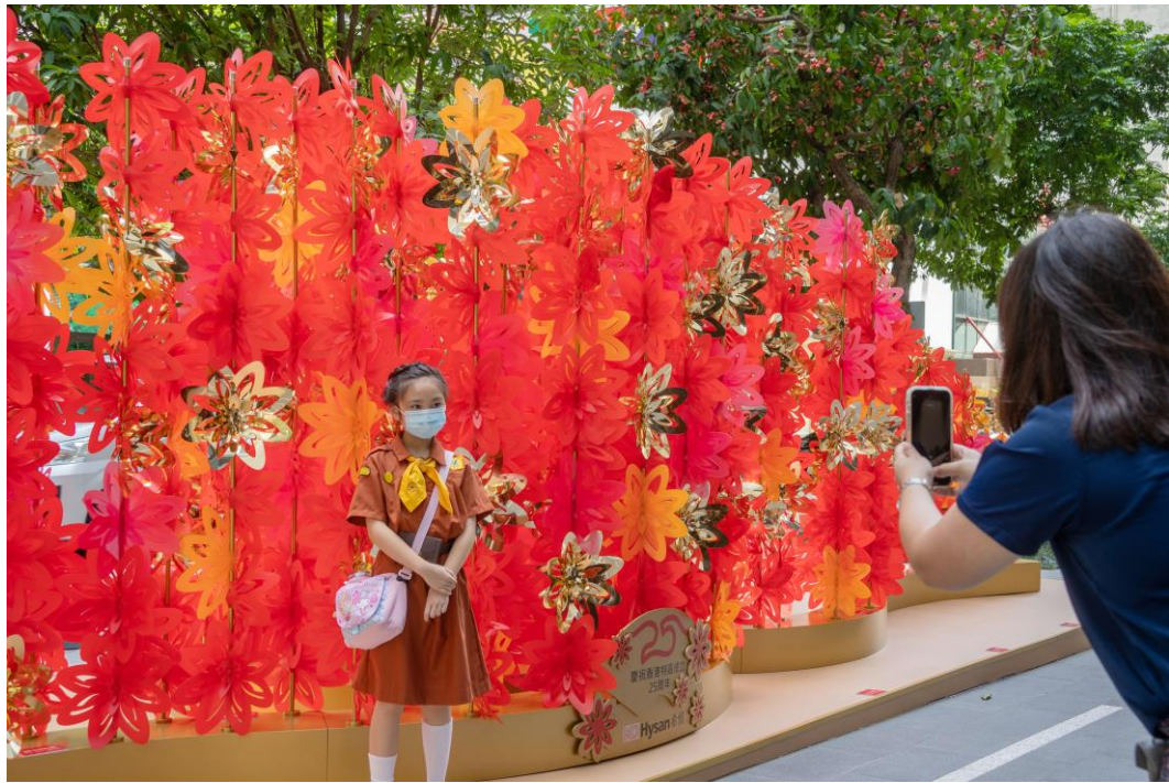
希慎盼能透过是次展览，带动市民积极投入庆祝香港回归二十五周年的活动。