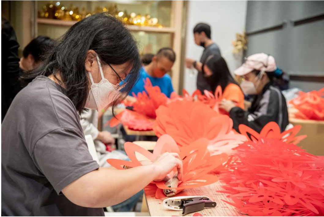
5,000 朵「利园花」来自香港专业教育学院（观塘）和富领袖网络的香港年轻新一代，与非牟利机构女布社的基层妇女，以一双手推动本地制作。