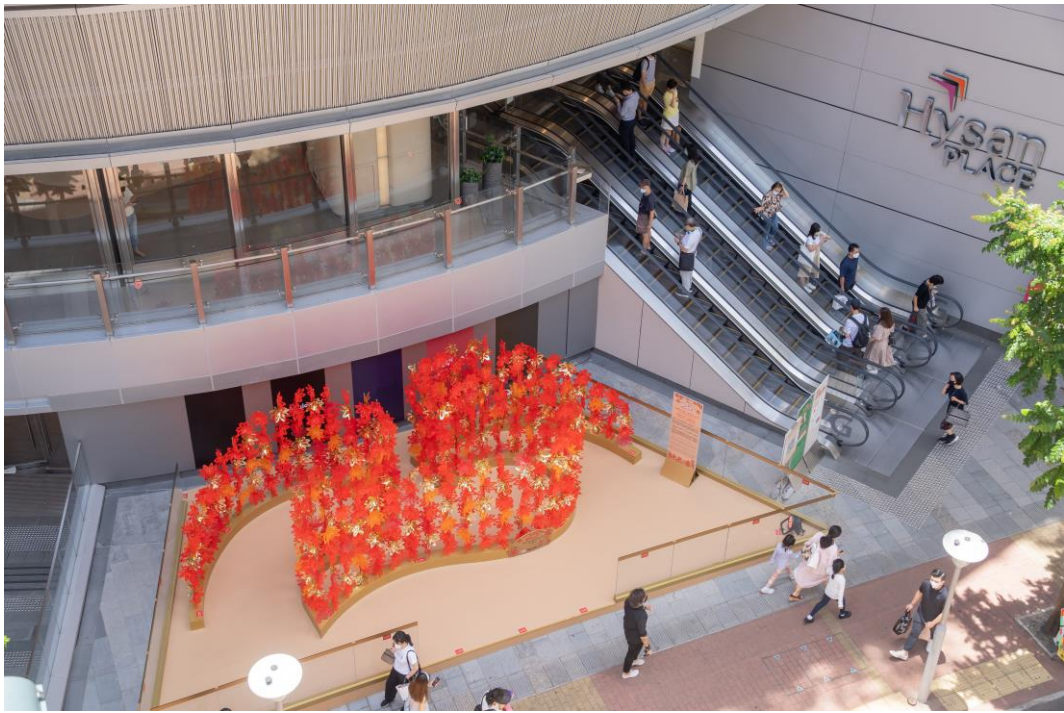
展品从高处观看可见充满动感的「25」线条。