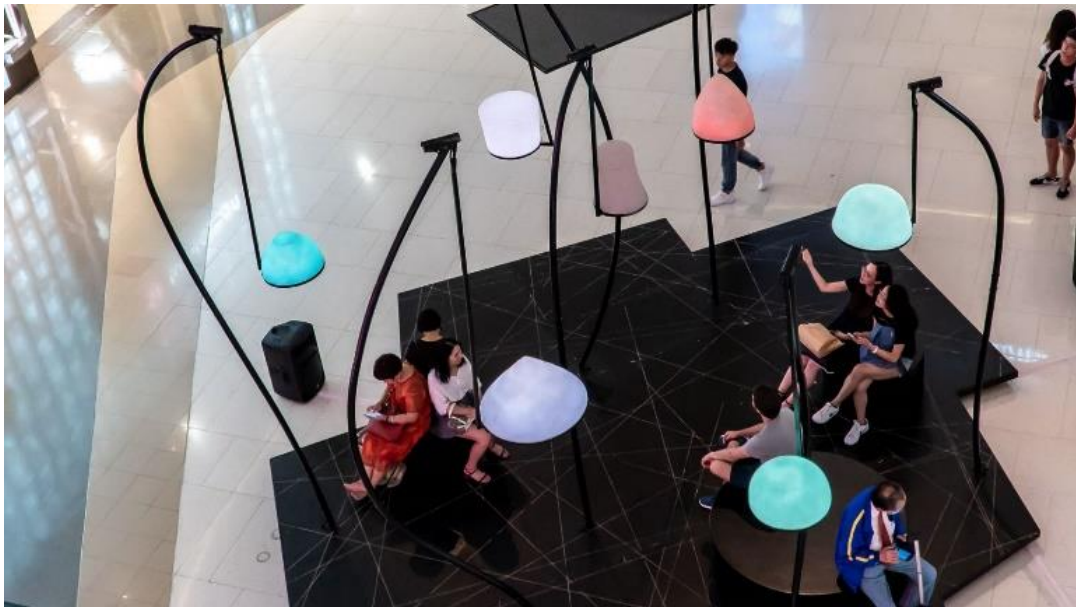
標題：由藝術家、音樂家及導演 Dimitri de Perrot 創作並於希慎廣場展出的藝術裝置《UNLESS》。

由香港藝術中心呈獻的瑞士藝術家、音樂家及導演 Dimitri de Perrot 創作的藝術裝置《UNLESS》。展覽今日開幕，作品由即日起至24日（二）於希慎廣場1樓中庭展出。